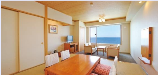
特別室(最大定員6名/7階～10階)