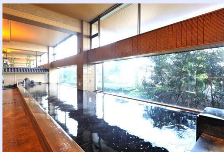
1階・3階木更津三日月温泉 (塩化物強塩温泉)