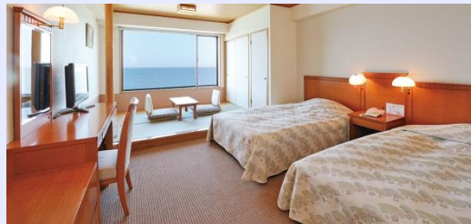
基準室(最大定員4名/1階～6階)