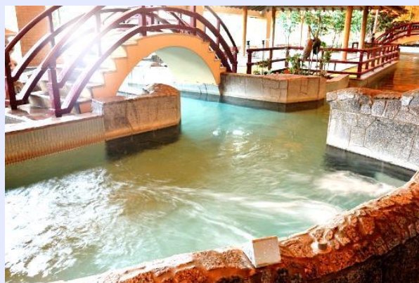
はだかプール(1階・3階)