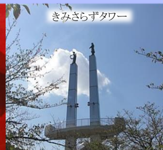
きみさらざタワー