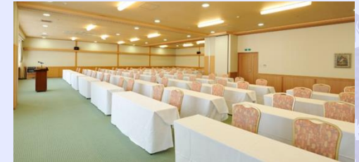
多目的ホール(スパ棟2階)