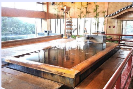
檜風呂 1階「夢舞台の湯」・3階「乙姫の湯」