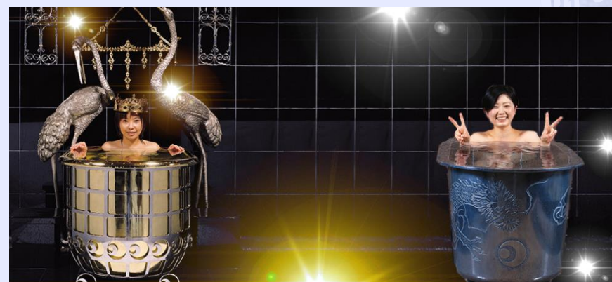
黄金風呂・銀風呂(1階・3階)