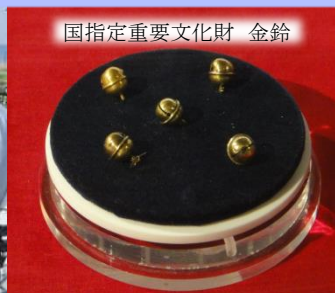
国指定重要文化財 金鈴