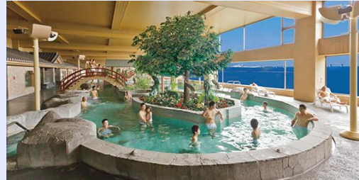
大浴場(スパ棟1階・3階)