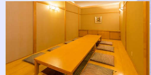
スパ棟5階 小宴会場